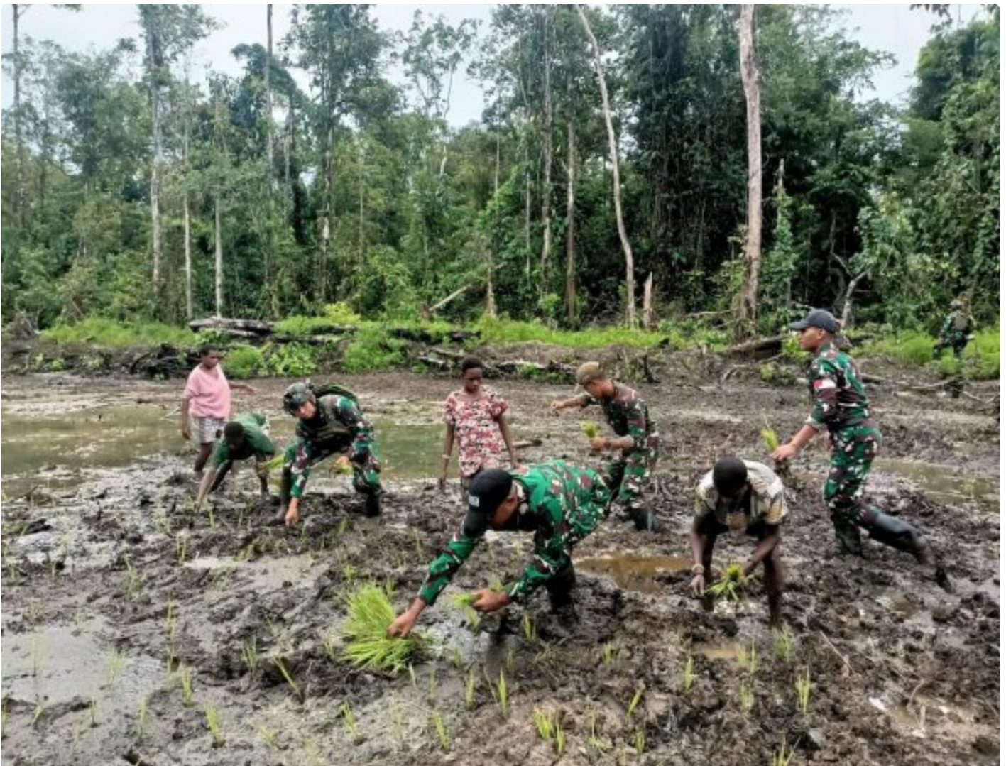
Foto: Satgas Pamtas Mobile RI-PNG Yonif 503/Mayangkara menggagas program ketahanan pangan yang melibatkan langsung warga Kampung Mumugu, Distrik Krepkuri, Kabupaten Nduga, Selasa (07/01/2025).

NDUGA- Dalam upaya membangun kesejahteraan masyarakat di wilayah penugasan Papua Pegunungan, Satgas Pamtas Mobile RI-PNG Yonif 503/Mayangkara