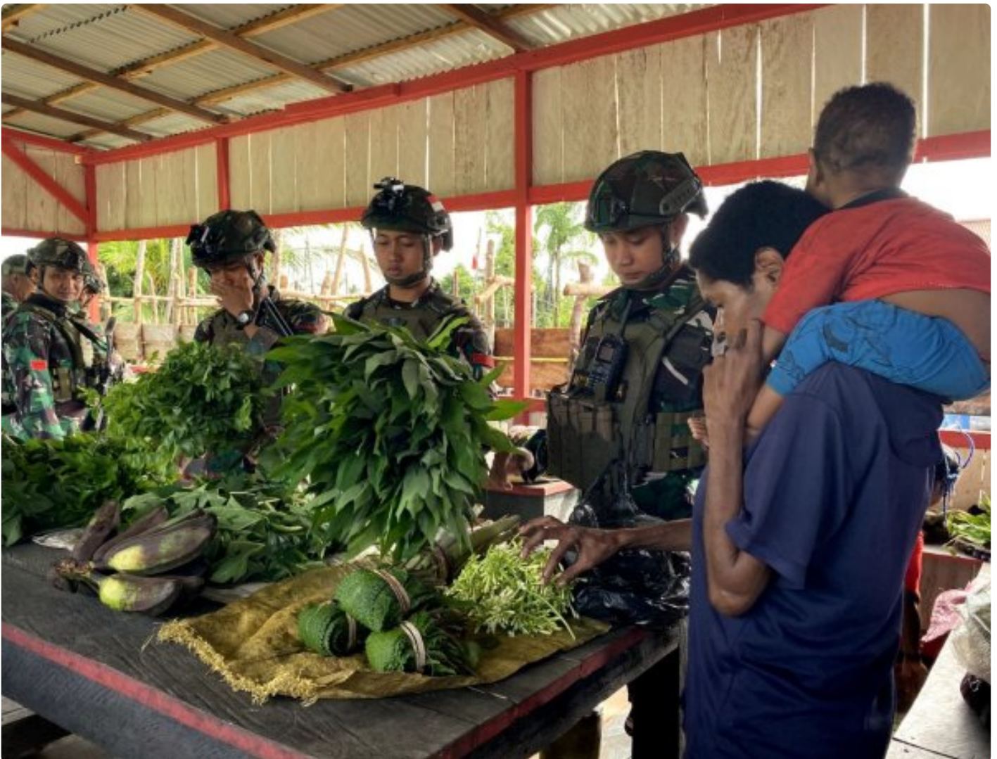
Foto: Para prajurit Satgas Pamtas Mobile RI-PNG Yonif 503/Mayangkara menjadi pahlawan sehari bagi para Mama Papua, memborong habis hasil kebun berupa sayur-mayur, ubi, dan pisang.

NDUGA - Sebuah pemandangan mengharukan terjadi di Pos Batas Batu, Distrik Krepkuri, Kabupaten Nduga, Senin (18/11/2024). Para prajurit Satgas Pamtas